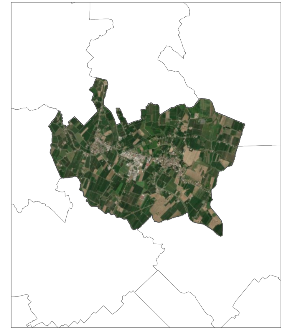
Tavola 11 scala 1:3.000